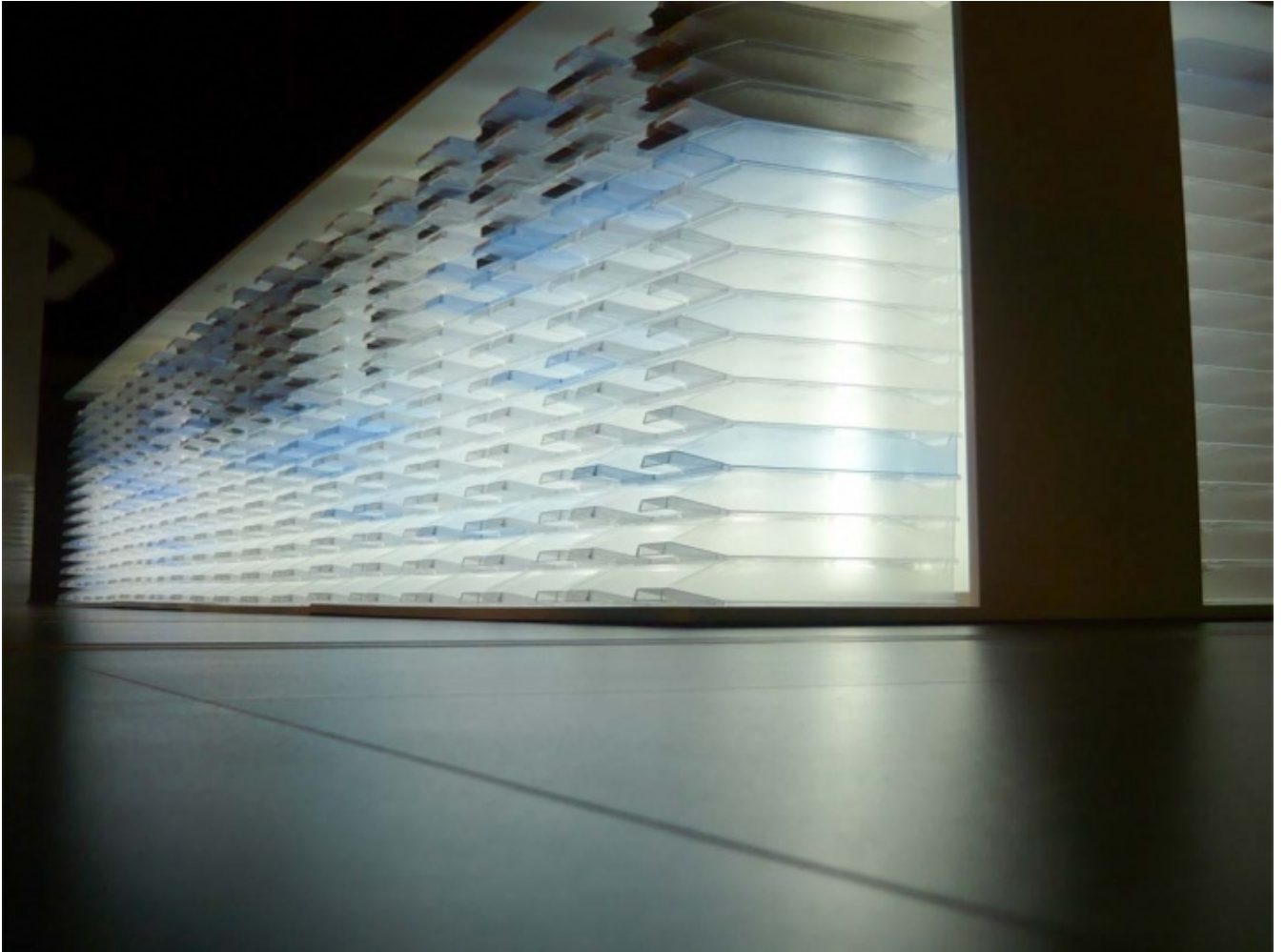
Banque Mémoire GERFLOR