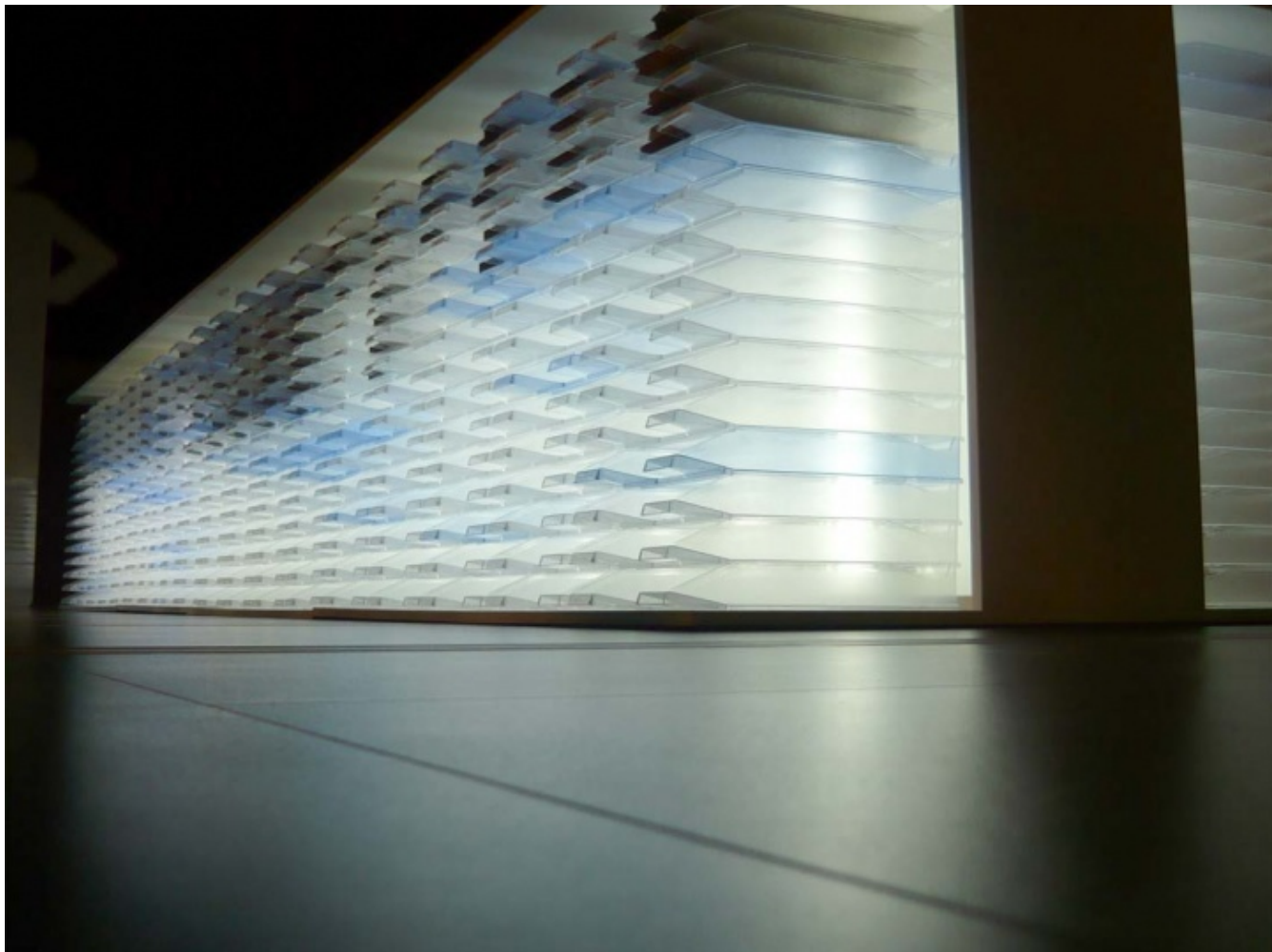
Banque Mémoire GERFLOR